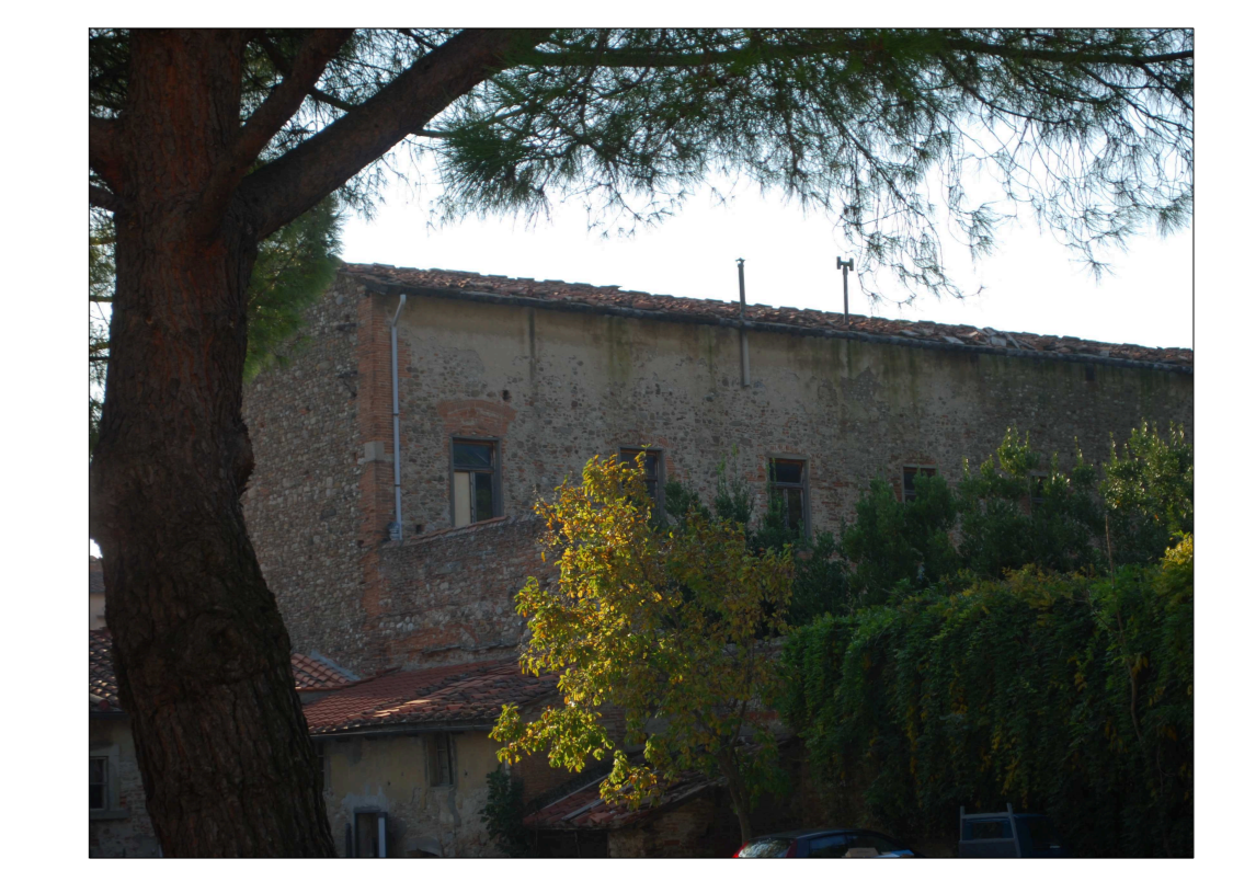
Copertura in oggetto dalla corte del centro di accoglienza