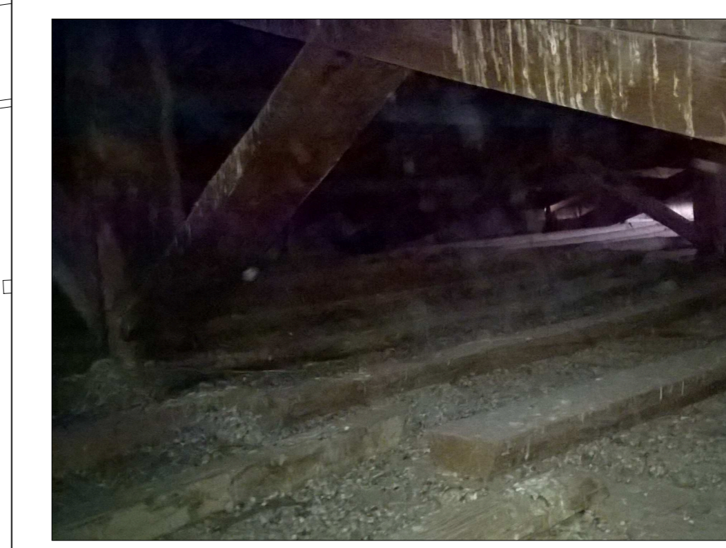
Particolare della capriata lignea