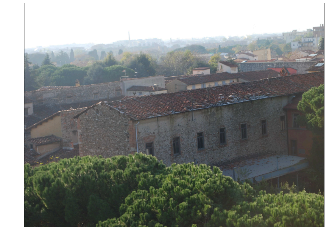
Vista dall'alto della copertura oggetto dell'intervento (falda prospiciente la corte interna)