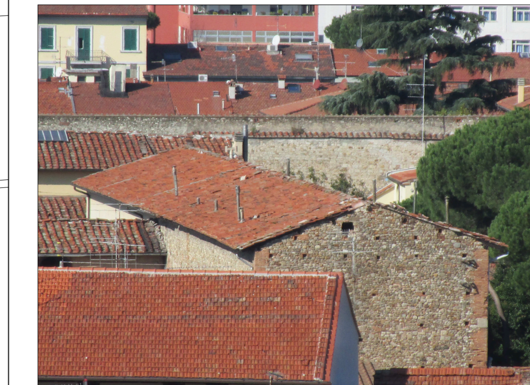
Vista dall'alto della copertura oggetto dell'intervento (falda lato via San Vincenzo)