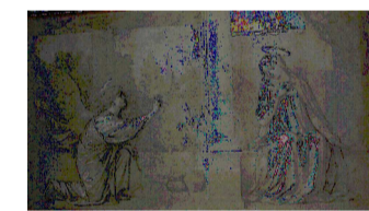
A. Franchi, L'annunciazione