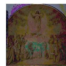
A. Franchi, La consegna della cintola