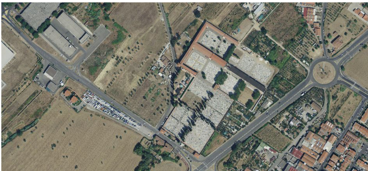
Foto area anno 2009

Confini dell'area oggetto di concorso (secondo la previsione del R.U.):